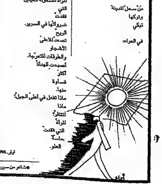
التي زرناها ببهمة من الشمال على طرف سابع ما كان ليرى في بلد...